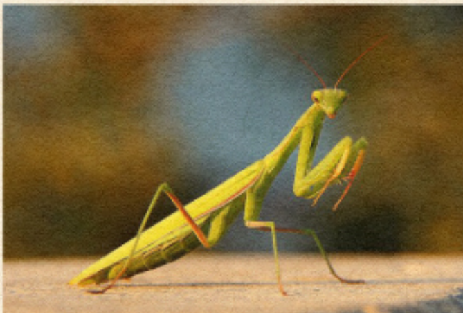
Mantidi religiose: nelle leggende si dice che questi insetti siano in grado di indicare la strada giusta con le loro due zampe anteriori a chi si è perso.