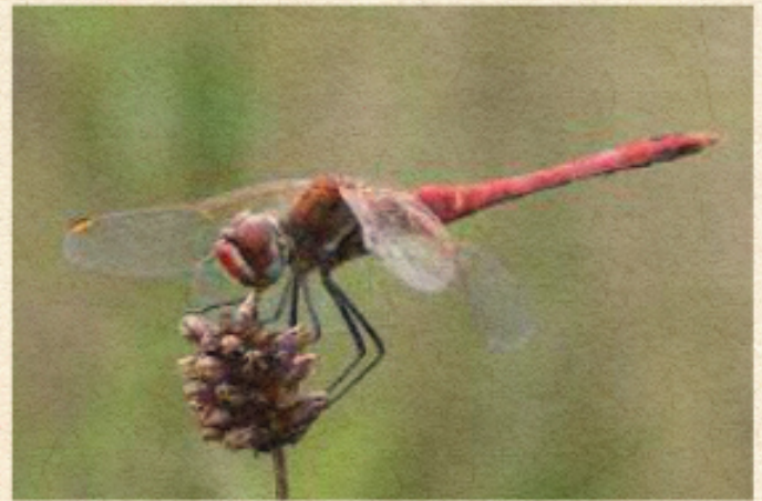
Libellule: un segno di aria e acqua pulite.