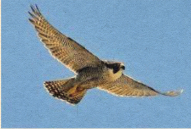
Un falco pellegrino: si dice che colpisce la sua preda dopo una picchiata mozzafiato a 390 km all'ora.